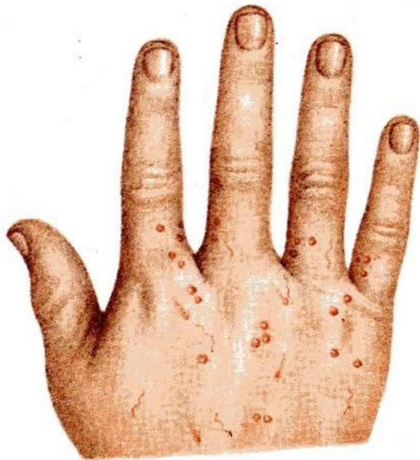
Рис. 62. Чесс

А — чесоточный зудень ( Ascarus sigo ), сам ного хода (в середине), хода самца (спр клещей рода Ascarus ; 1 — самка; 2 — яй ные отверстия; 5 — оплодотворенная теле 8 — живые кле