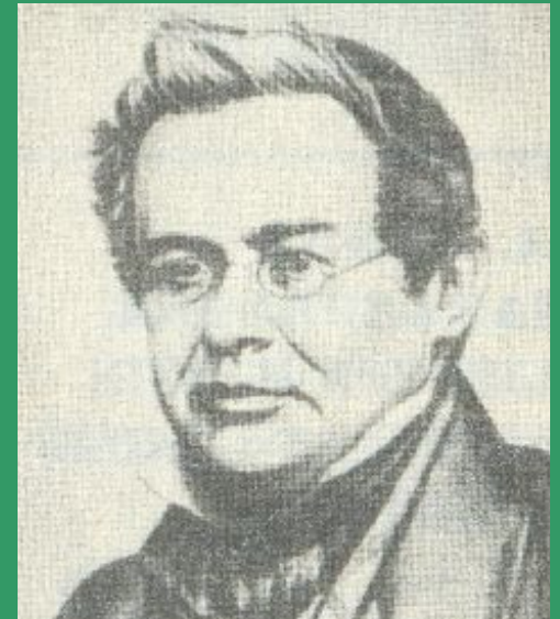
Ленц Эмилий Христианович