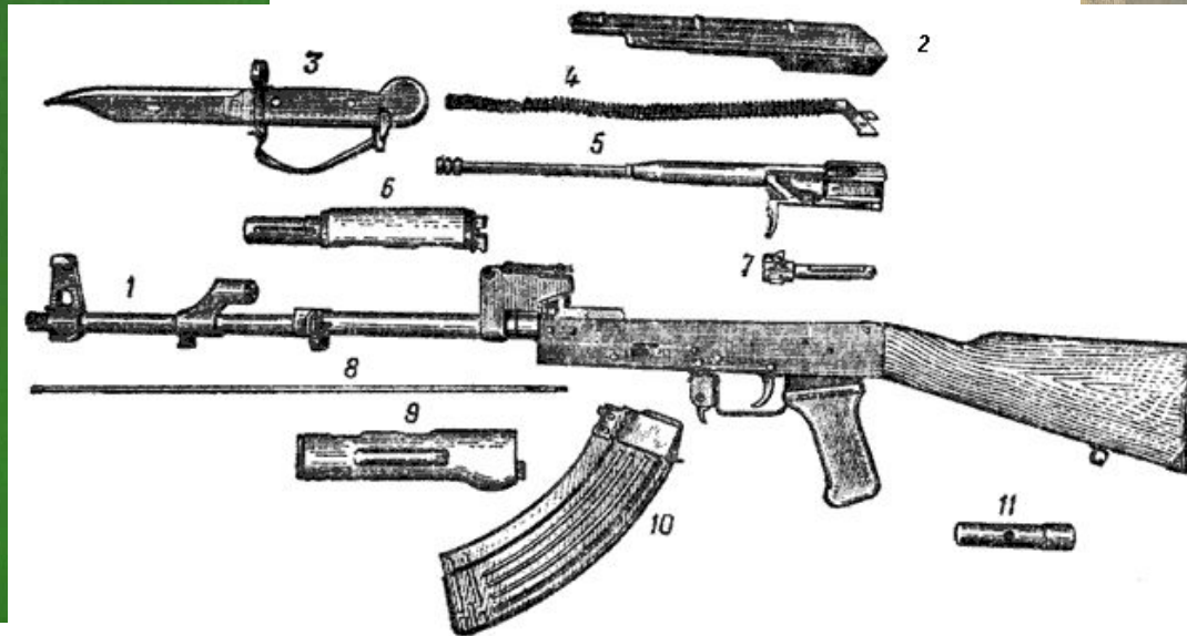
Рис. 2. Основные части и механизмы автомата:

1 — ствол со ствольной коробкой, с прицельным приспособлением и прикладом; 2 — крышка ствольной коробки; 3 — штык-нож; 4 — возвратный механизм; 5 — затворная рама с газовым поршнем; 6 — газовая трубка со ствольной накладкой; 7 — затвор; 8 — шомпол; 9 — цевье; 10 — магазин; 11 — пенал с принадлежностью